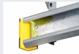
Laufschiene-Enden stoßsicher verkleidet