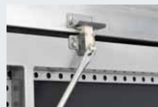
Selbsttätig einrastende Schnäpperverriegelung