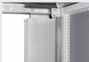
Komplett verkleidete Gegengewichte