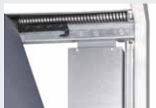
Sichere Torführung in senkrechten und waagerechten Führungsschienen, abgebremstes Öffnen und Schließen durch Anschlagdämpfer