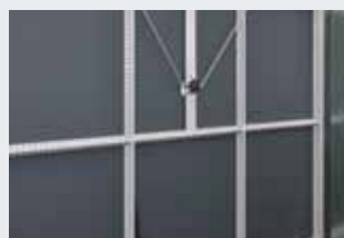
Stabile Rechteckrohr-Konstruktion mit Verstärkungsstreben