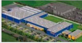
Hörmann KG Antriebstechnik, Deutschland